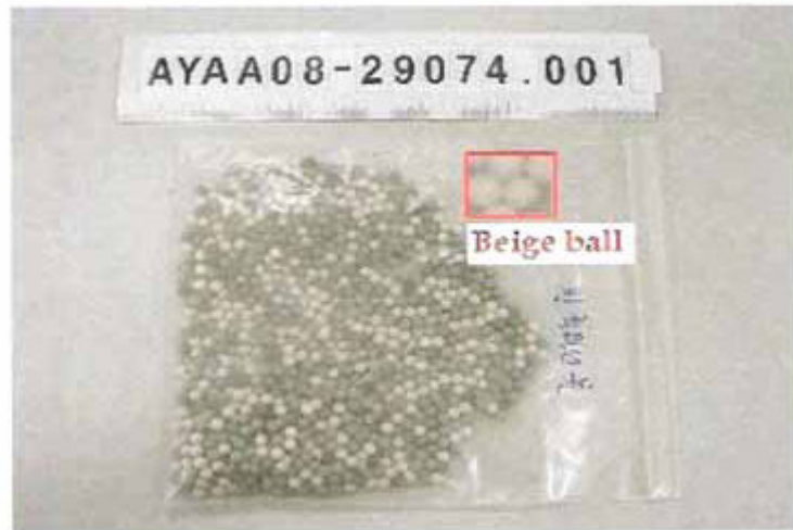
Imagen de muestra recibida