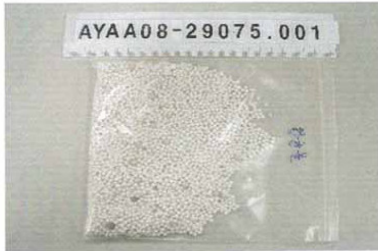
Imagen de muestra recibida