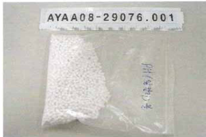
Imagen de muestra recibida