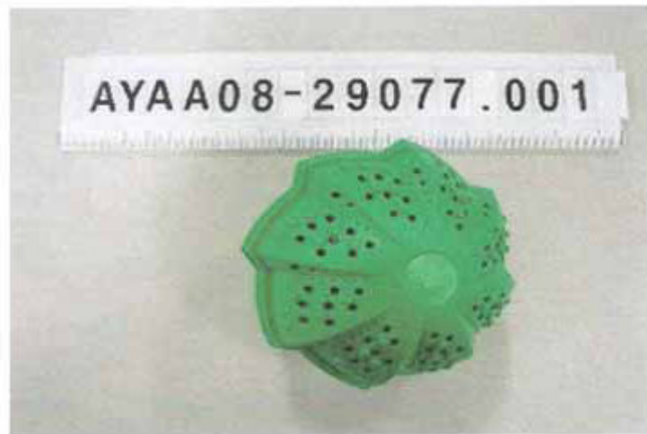
Imagen de muestra recibida