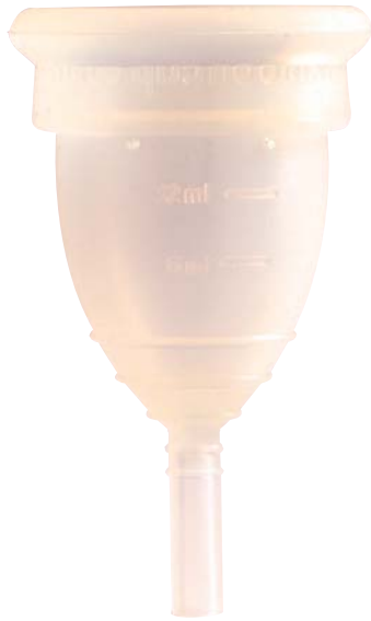
Imagem a tamanho natural