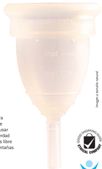
Imagen a tamaño natural

Fabricado en el Reino Unido para Mooncup Ltd, Dolphin House 40 Arundel Place, Brighton BN2 1GD, Reino Unido Impreso en papel reciclado con tintas de origen vegetal